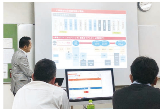
各店舗での説明会実施中